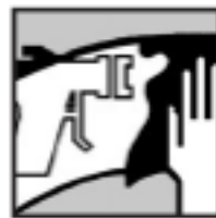
Werkzeugreinigung mit Wasser