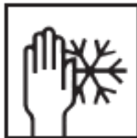
Frostsicher transportieren u. lagern